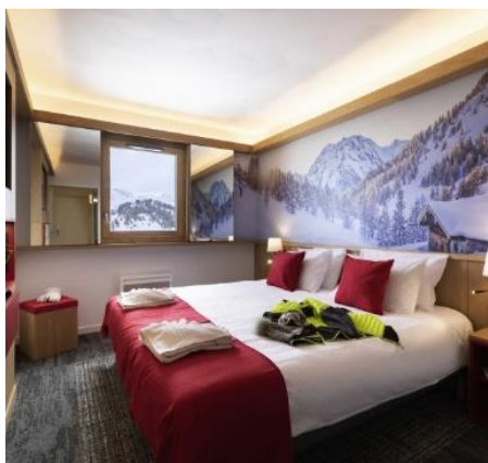
Chambre 2 personnes