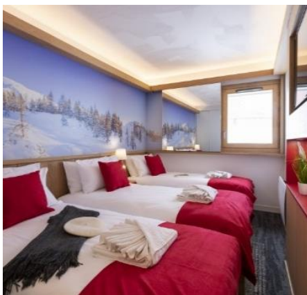
Chambre 3 personnes (2 adultes et 1 enfant)