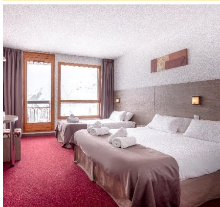
Chambre 3 personnes